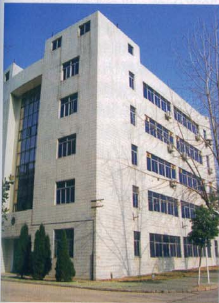
华安瑞位于武汉经济开发区科技园内

Johnson: 从事哈佛商业顾问工作时，我曾协助许多大公司对投资中国作过风险评估。的确，投资有风险，