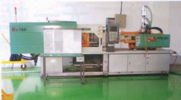
华大提供的高端注塑机