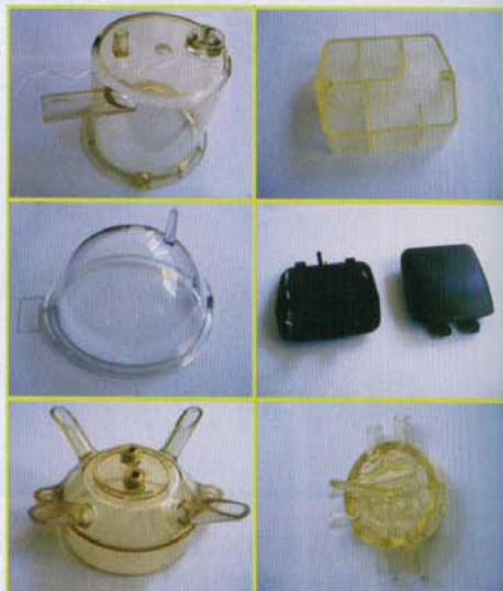
针对国内市场开发的高性能热塑性注塑件产品

我们是独一无二的，不同于其它注塑厂家。当前普通塑料件的注塑厂商到处都是，但很少有为全球OEM厂商定制高性能热塑性注塑服务的厂家，这为我们提供了巨大的市场空间。